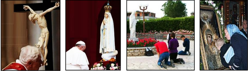
Figura 4: ¿Jesús alguna vez postró ante una estatua?

“Yo perseguí a muerte a este Camino (los primeros cristianos), encadenando y arrojando a la cárcel a hombres y mujeres.” (Hechos, 22: 4-5)