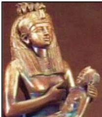
Isis amamantando a Horus

El concepto de confesar los pecados a un sacerdote no fue enseñado por Jesús (PyB) en la Biblia. Dios perdona todos los pecados como si se los confesáramos directamente a Él (1 Juan, 1: 9). No necesitamos mediadores entre nosotros y Él.