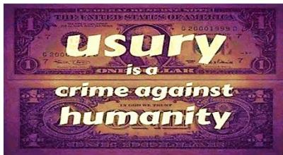
Figura 4: La usura es uno de los crímenes contra la humanidad. Witzsche, A.F. (2003) Discovering infinity, volume 1B: Crimes against humanity, Cygni Communications Ltd, North Vancouver, BC, Canada

¿Se contradeciría Dios a veces alentando y algunas veces desalentando a beber? O alternativamente, ¿las historias de consumo de alcohol en la Biblia