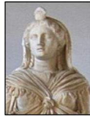
Isis, Museo Capitolino, Roma., Siglo I a. de C.