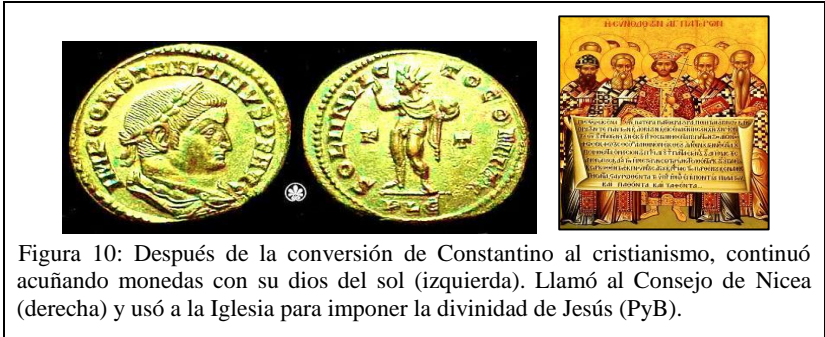
Figura 10: Después de la conversión de Constantino al cristianismo, continuó acuñando monedas con su dios del sol (izquierda). Llamó al Consejo de Nicea (derecha) y usó a la Iglesia para imponer la divinidad de Jesús (PyB).

Después de siglos de debates y disputas, la Iglesia, con la ayuda del emperador Constantino, logró sustituir el cristianismo de Jesús por el cristianismo paulino. La naturaleza trina de Dios Padre, Dios Hijo y Dios Espíritu Santo se cristalizó en los concilios de Nicea y Constantinopla, que se celebraron en los años 325 d. de C. y 381, respectivamente.