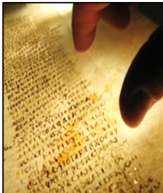
Figura 1: La Biblia más Antigua que se conoce (1600 años) fue encontrada en un monasterio en el desierto del Sinaí en Egipto hace más de 160 años atrás. Incluye dos libros que no forman parte del Nuevo Testamento oficial y al menos siete libros que no forman parte del Antiguo Testamento. Los libros del Nuevo Testamento están en un orden diferente e incluyen numerosas correcciones a mano. Los pasajes importantes que hablan de la resurrección de Jesús no están.

Cuando la iglesia los compiló, eligió los textos escritos en el antiguo lenguaje griego Koiné y no el lenguaje Arameo hablado por Jesús (PyB)