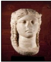
Isis, Museo Arqueológico Nacional, en Atenas, Grecia.